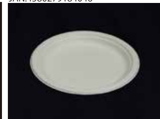
P013 皿 (L)