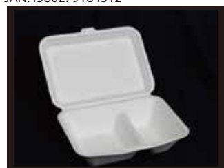
B011 仕切り付きフードパック(L) 155mm×207mm×64mm ※フタを閉じたサイズ 1000個(50個×20袋)