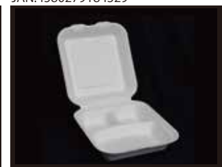
B031 弁当容器 3仕切り 220mm×205mm×66mm ※フタを閉じたサイズ 600個(50個×12袋)