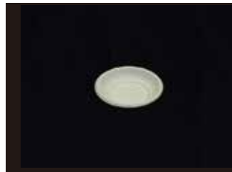
P019 皿 (S)