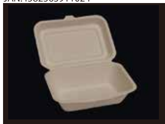
B001M フードパック(L) 135mm×182mm×65mm ※フタを閉じたサイズ 1000個(50個×20袋)