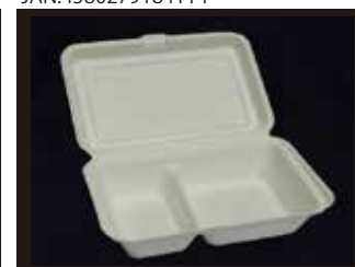
B002 仕切り付きフードパック(LL) 165mm×250mm×65mm ※フタを閉じたサイズ 800個(50個×16袋)