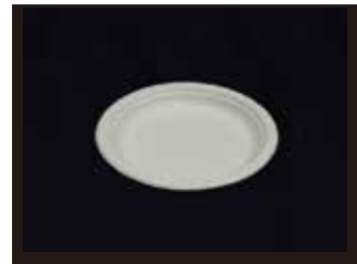
P011 皿 (M)