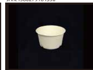
L047B カップ 350ml 口径105mm×60mm 1000個(50個×20袋)