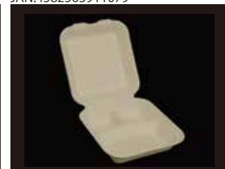
B036M-3C 弁当容器 3仕切り 220mm×203mm×75mm ※フタを閉じたサイズ 600個(50個×12袋)