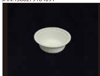
L026B お碗 350ml 口径135mm×42mm 1800個(50個×36袋)