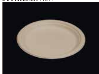
P013M 皿(L) 直径230mm×20mm 1500個(50個×30袋)