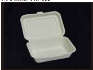
B004 フードパック(M) 127mm×171mm×52mm ※フタを閉じたサイズ 1200個(50個×24袋)