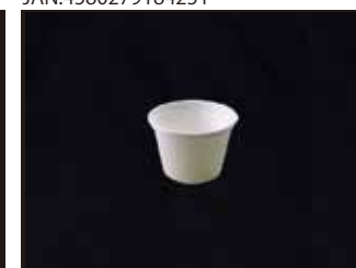
L048 カップ 140ml 口径77mm×54mm 2400個(50個×48袋)