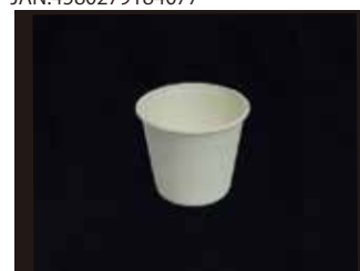
L028 カップ 425ml 口径105mm×83mm 800個(50個×16袋)