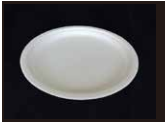
P005 皿 (LL)