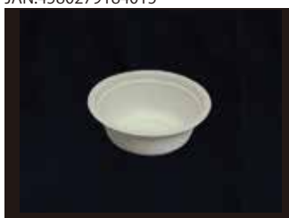
L004 お碗 600ml 口径155mm×63mm 1000個(50個×20袋)