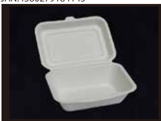
B001 フードパック(L) 135mm×182mm×65mm ※フタを閉じたサイズ 1000個(50個×20袋)