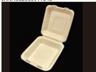
B036M 弁当容器 220mm×203mm×75mm ※フタを閉じたサイズ 600個(50個×12袋)