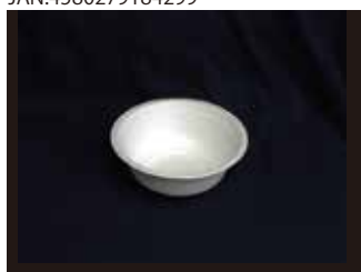
L001 お碗 500ml 口径155mm×54mm 1200個(50個×24袋)