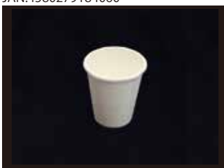
EC-L051 コップ 240ml 口径83mm×90mm 1500個(50個×30袋)